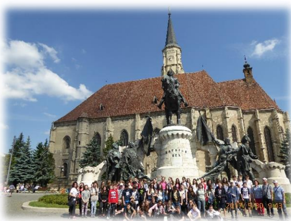
Fotók: Lakatos Ferenc 2017.